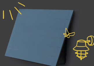
FIXÉ EN APPLIQUE